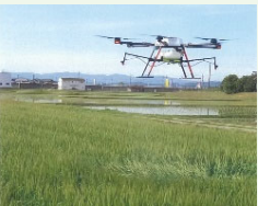
〔例〕 スマート農業機器の活用