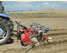
大豆300A技術（不耕起播種栽培など）