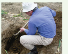
土壌診断に基づく土づくり