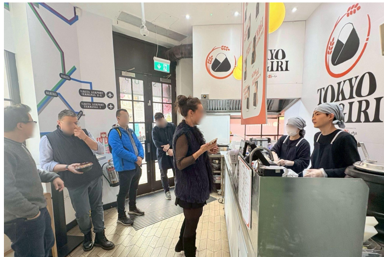
店内の様子 JAPAN CENTREフラッグシップストアPOP UPスペース