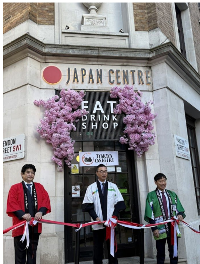
2025年12月 開業セレモニー