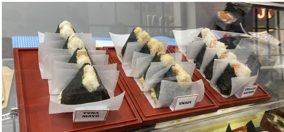
人気のツナマヨ(左)うなぎ(中央)鮭(右)