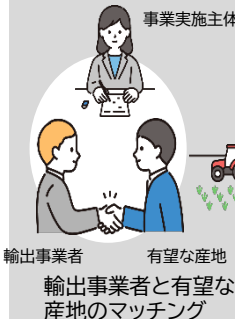
輸出事業者 有望な産地 輸出事業者と有望な産地のマッチング