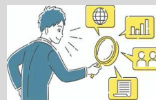
リサーチ情報共有

海外での市場リサーチからテストマーケティングに至る初期活動の支援により未開拓地域・商材の市場開拓を後押し