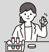
残留農薬・重金属検査