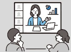
海外実需者が求める国際認証取得への対応