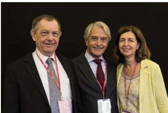
写真左から、 ・ヴァラOIE事務局長 ・ティアマン前OIEコード委員会議長 ・エロワ新事務局長