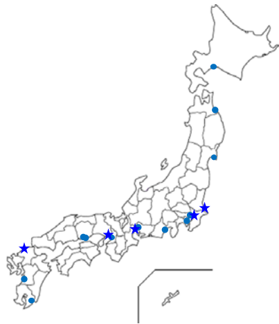
ア. ナタネ類調査港