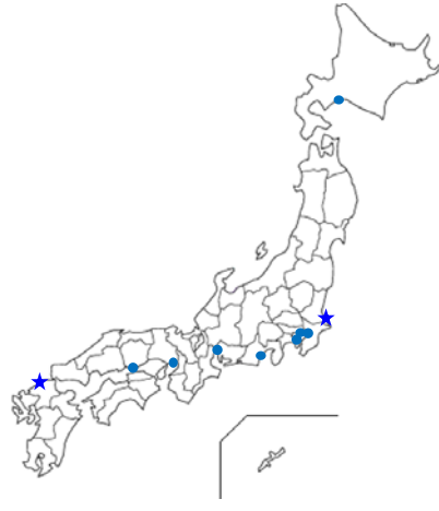
イ. ダイズ及びツルマメ調査港