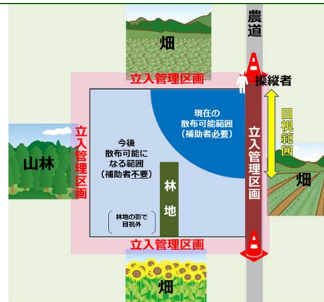
<立入管理区画の設定イメージ>