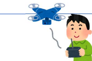
②操縦者の飛行経歴・知識・技能