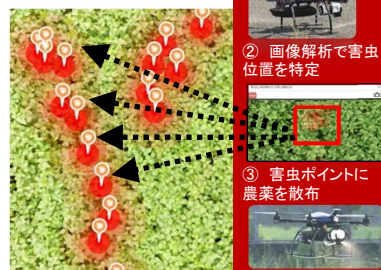
ピンポイント農薬散布