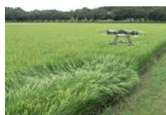
2cm精度で畦際まで均一散布