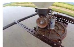
鉄コーティング種子の自動直まき