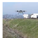
畦畔法面での除草剤散布