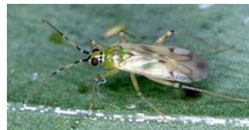
タバコカスミカメ