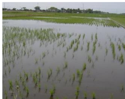
移植直後に食害を受けた移植苗