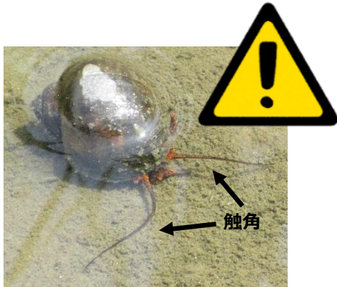
ジャンボタニシ（スクミリングガイ）