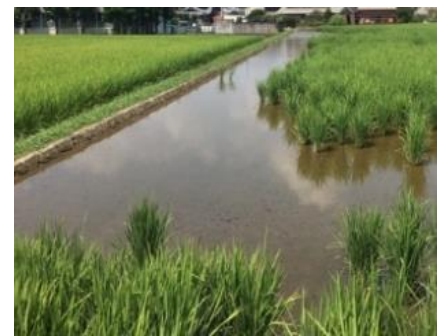
食害を受けやすい 入水口・排水口や周縁部（畦際付近）