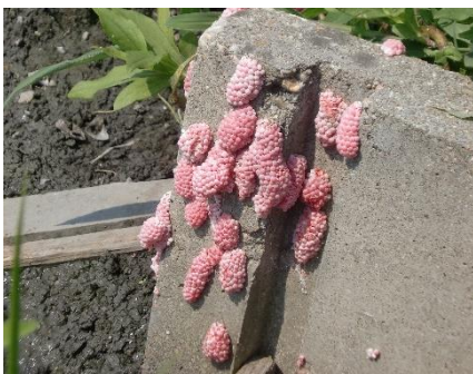
用水路（水口）の卵塊