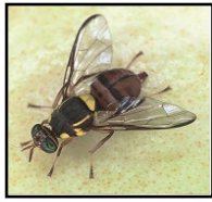
ミカンコミバエ種群