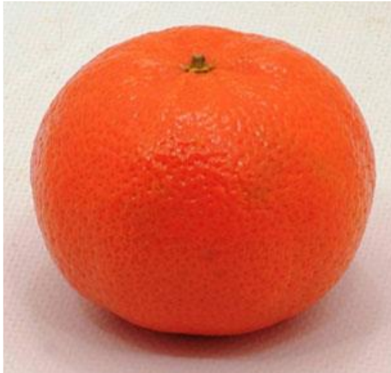
マンダリン ( Citrus reticulata )

みかん属の一種。 果実は偏球形。果皮は黄橙色で極めて薄く、果肉はやや酸味があるものの香りを有するとされている。