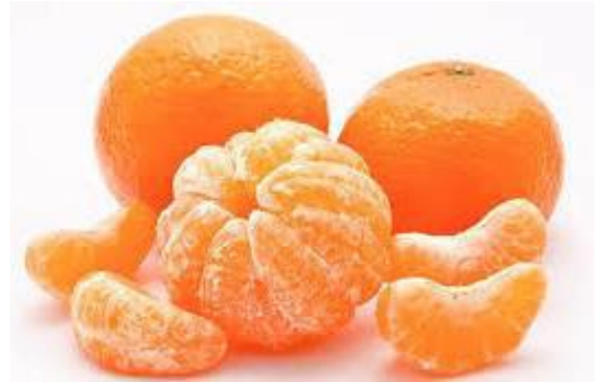
クレメンティン ( Citrus clementina )

みかん属の一種。 果実は偏球形。果皮は橙色で、果肉はしまっていて果汁が多く、甘みが強く程よい酸味を有するとされている。