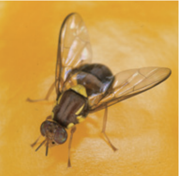
クインスランドミバエ