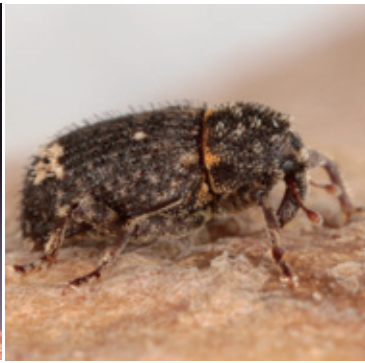
イモゾウムシ成虫