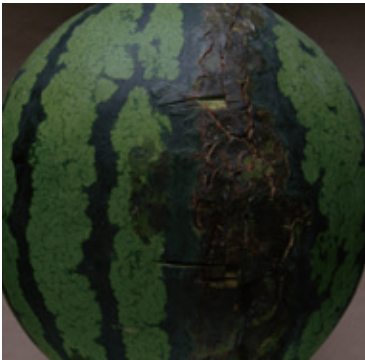
スイカ果実汚斑細菌病