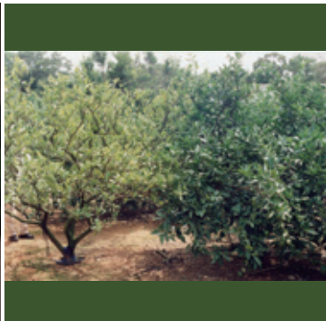
カンキツグリーンング病 (左：感染樹、右：健全樹)