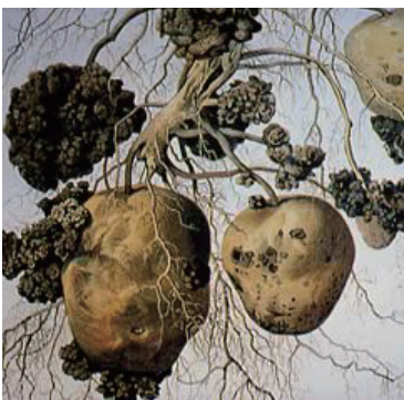
ジャガイモがんしゅ病