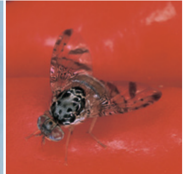
チチュウカイミバエ