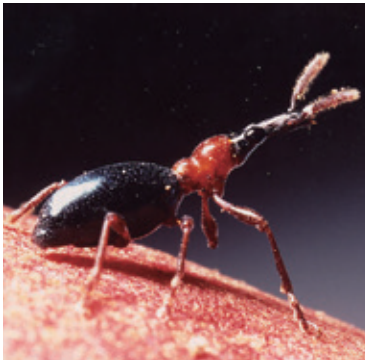
アリモドキゾウムシ