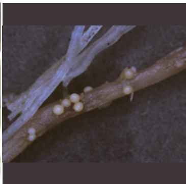
ジャガイモシストセンチュウ (ジャガイモの根に寄生するシスト)