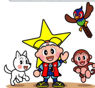
岡山県マスコット ももっち