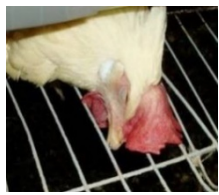
(豚熱及び鳥インフルエンザの症状)