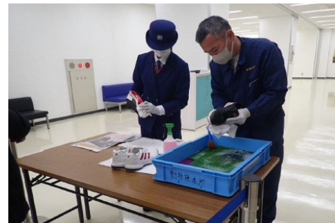
<国際空港における旅客の靴の消毒>