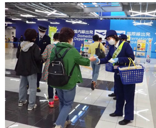
<空港における広報キャンペーン>