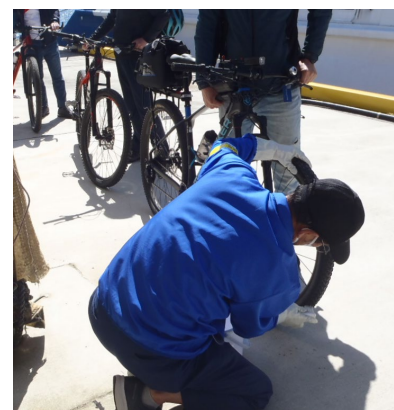
<港における自転車消毒>