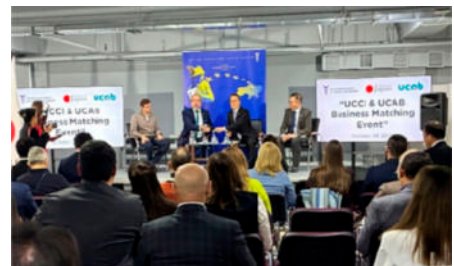
ウクライナへの食料・農業分野の官民ミッション

バングラデシュにおいては、同年11月に、我が国企業によるバングラデシュへの輸出・事業展開の促進に向けて、同国への食料・農業分野の官民ミッションを派遣し、現地の政