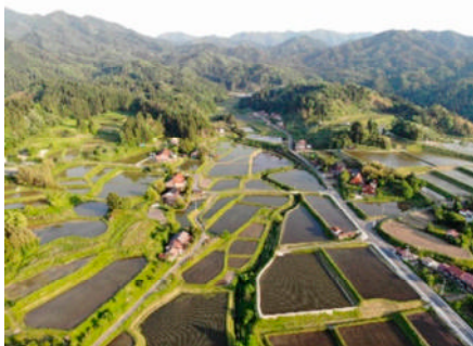
島根県奥出雲地域

農林水産省は、農業遺産地域の魅力を広く発信し、地域活性化を図る取組の一環として、農業遺産地域等の高校生による複数の農業遺産地域の製品を使った食品のアイデアを競う「高校生とつながる！つなげる！ジーニアス農業遺産ふーどコンテスト」を開催しています。