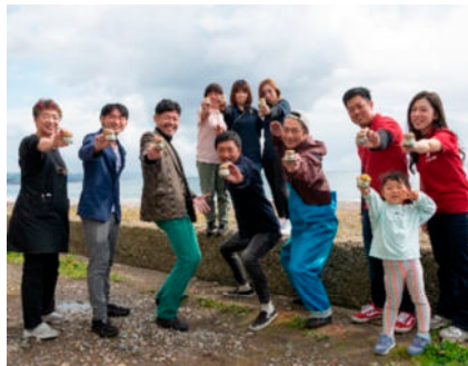
未利用・低利用魚を活用した商品開発を行う団体 (「ディスカバー農山漁村の宝」(第12回選定)のグランプリ受賞)

農林水産省は、選定された地区の活動を「ディスカバー農山漁村の宝」特設ウェブサイト等で紹介し、情報発信することにより、農山漁村地域の活性化に対する国民の理解の促進に取り組むとともに、農山漁村における所得の向上と雇用の創出を推進しています。