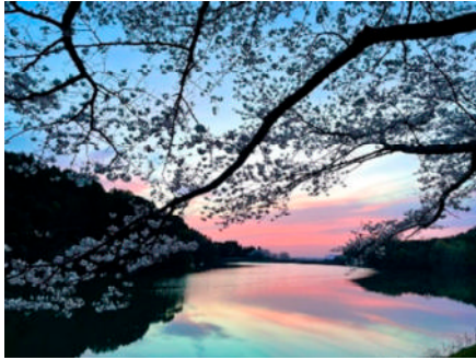
湯の口ため池・井手(熊本県山鹿市)

ようすいぐん たけたし 用水群(大分県竹田市)の2施設が認定され、国内認定施設数は56施設となりました。世界かんがい施設遺産を活用した、かんがいの歴史と発展の理解促進、地域活性化を図る取組を推進しています。