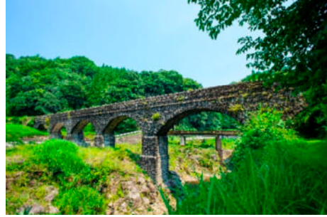
竹田のかんがい用水群(大分県竹田市)