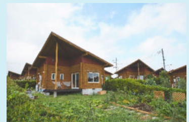
宿泊施設付き市民農園