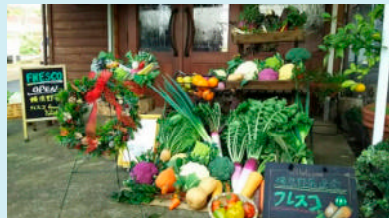
直売所で販売している野菜