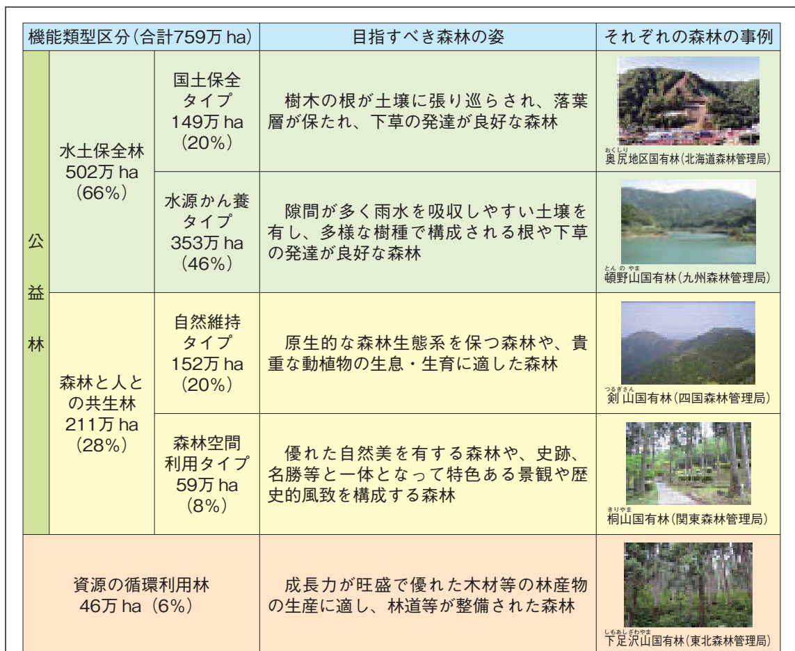
表V-1 国有林野の機能類型区分ごとの目指すべき森林の姿

また、管理経営基本計画に即し適切かつ効率的な管理経営を行うため、国有林野を重点的に発揮させるべき機能によって「水土保持林」、「森林と人との共生林」、「資源の循環利用林」の3つの類型に区分している（表V-1）。