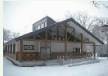
森林づくり活動等拠点施設

北海道森林管理局知床森林センターは、多様な主体による協働型の「知床自然の森林づくり」を進めている。平成19年度には、目指すべき森林の姿や活動方針を定めた「知床自然の森林再生ビジョン」や活動適地と活動メニューを示した「知床自然の森林づくり応援マップ」等を作成するとともに、斜里町ウトロ地区に国民参加による森林づくり活動や森林環境教育の拠点となる施設を整備した。