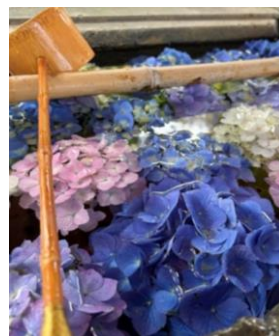
手水舎に浮かぶアジサイ (水戸市 保和苑)