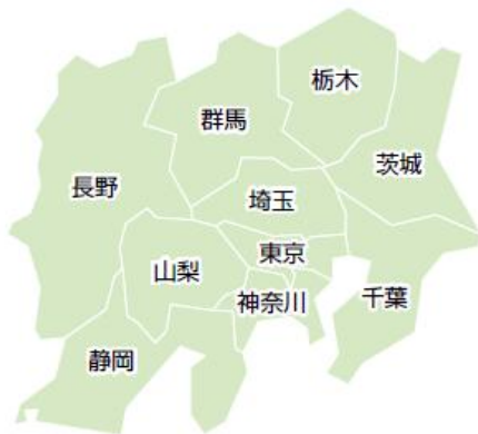
■ 関東農政局の位置

1都9県を管轄し、生産や消費の現場に近い国の機関として、食料・農業・農村に関する施策の普及や地域の実態の把握を行い、食料の安定供給や、農山漁村の活性化、食の安全・安心の確保など、幅広い農林水産行政を実施しています。