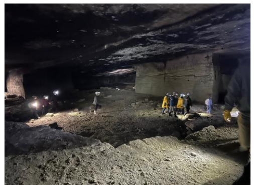
当時のままの石切場跡を探検

* 大谷グリーン・ツーリズム推進協議会HP https://oya-gt.jp/