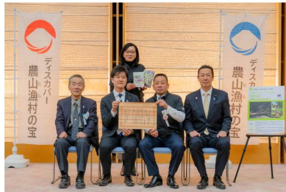
選定地区による交流会 (鈴木農林水産大臣とともに記念撮影)

・非公開の石切場跡“洞窟X”を安全確認の上で管理し、団体予約による探検ツアーを実施 (年間約100名)。教育旅行では地域ガイドを育成して、オリジナルの提案型で受入れ。人数や時間、英語対応など希望に合わせながら、当団体ならではの提案で、大谷石の歴史、里山保全、SDGs教育を実践 (ハワイの学生や中学生 (320名・バス9台) を受入れ)。