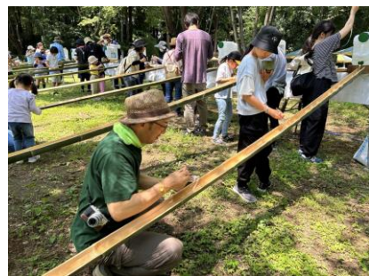
竹切体験で流しそうめん