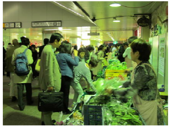
写真6 八王子駅前出張販売風景

これらの活動を通じて、組合員の意識は、最初はただ単に「できたものを売る」だったものが「作ったものを売る」へ変わり、今では「お客さんに売れるもの＝どういったものがお客さんに売れるのか」を考えるようになり、まさにマーケットインの考えが定着している。