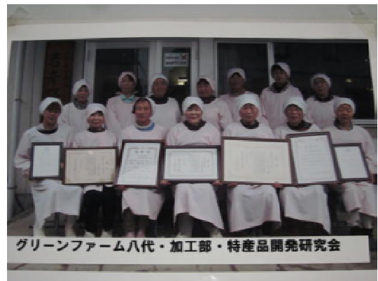
写真4 加工部のみなさん

平成23年11月にはPOSシステム*2を導入し、組合員はリアルタイムに商品の販売状況を把握できるようになり、品薄になった商品の補充を迅速に行うことが可能となるとともに、消費者のニーズに的確に対応することができるようになった。