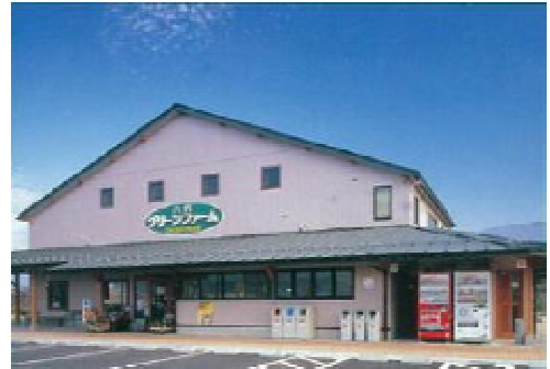
写真2 八代町のシンボル 農産物直売所

平成16年6月に『地元住民及び他地域住民の交流の場、女性も気軽に出荷できる農業者の新たな販路開拓施設』をコンセプトとして農産物直売所が建設され、施設の運営は、地域農業者を主体とする「八代町農産物直売所運営委員会」を設立し、直売所活動を開始した。