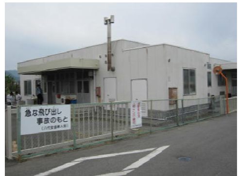
写真3 セントラルキッチンとして利用されている農産物加工センター

八代町農産物加工組合は同地区で活動していた様々な加工グループをまとめ、加工センターを中心に活動の調整を行っており、まさに農産物加工センターは、セントラルキッチンの様相を呈している。