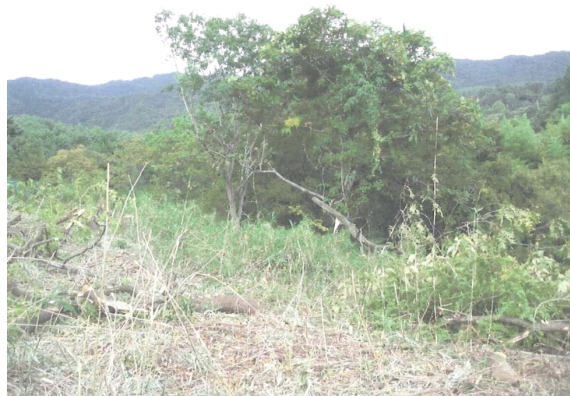
写真1 原生林と化した耕作放棄地

当地域の農地は狭少で不整形なため、米麦養蚕が主体の地域であった。養蚕の不振に伴い高い標高を活かした畜産（肉用牛・乳牛）やりんごの導入が図られたが定着せず、米と自家用野菜の生産にとどまった。農家の後継者である若い世代は地域外に定職を求め、地域の過疎化と高齢化が進んだことから、個人での農地の保全・管理が難しくなり耕作放棄地の鳥獣被害が深刻化し、地域のコミュニティ維持が厳しい状況となった。