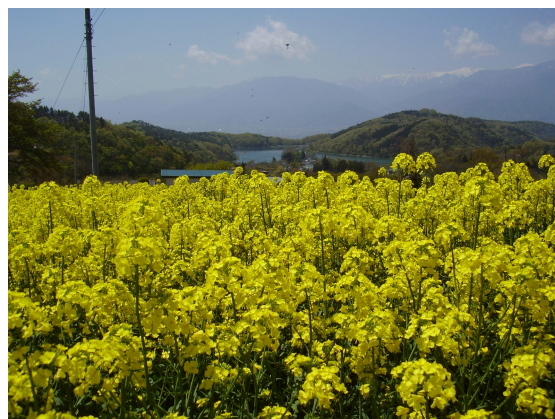
写真5 菜の花プロジェクトで景観改善

を講じることで、地域内の被害が減少となった。企業の社員等との交流が地域住民の農産物の生産意欲を刺激し、農産物の生産が増え始めた。一部地域住民は甲府市内にあるJA直売所で販売し、帯那地域の農産物は美味しいとの評判を得ている。今後は、移動手段のない高齢者等の農産物の販売機会確保に向け、地域内に直売所の設置を検討している。