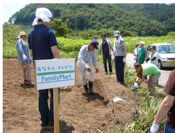
写真4 企業の農園づくり

山梨県の事業を活用して耕作放棄地から再生し鳥獣被害対策を行った農地で、「菜の花プロジェクト」や「レンタル牛活用放棄地対策モデル事業」（県事業）に取り組んでいる。地元小学生や地域住民（約200人）が参加して播種し、環境保全活動に取り組む農業機械メーカーの支援を得て収穫した菜種は、食用油として地域のイベントやコンビニエンスストア（ファミリーマート）で販売されている。