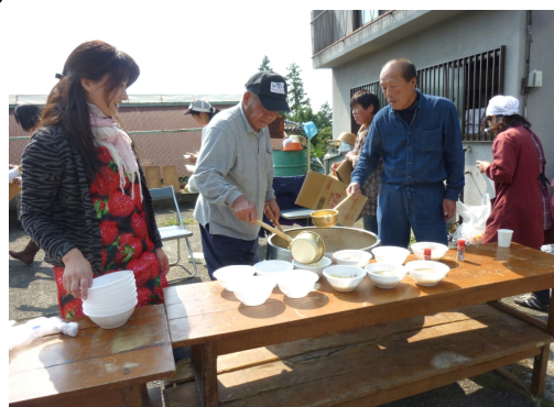
写真6 交流イベントで活躍

地元小学生と会員が一体となって、ため池の除草作業や外来魚（ブルーギルやブラックバス）を駆除する「外来種駆除対策大作戦」を実施し、地域の景観や生態系を守り水質の改善に努めている。