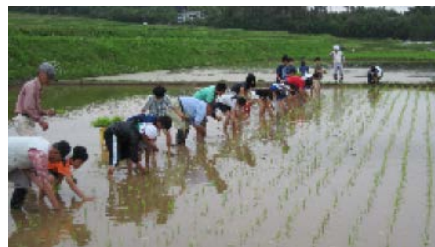
【田植えの様子(農業体験)】