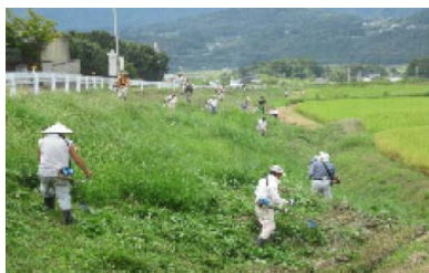
【農道の法面管理(共同作業)】