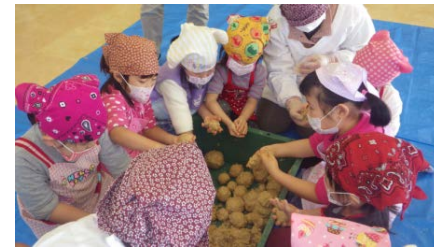
【味噌づくり体験教室】