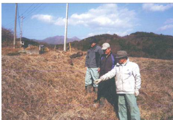
【農地法面の定期点検状況】