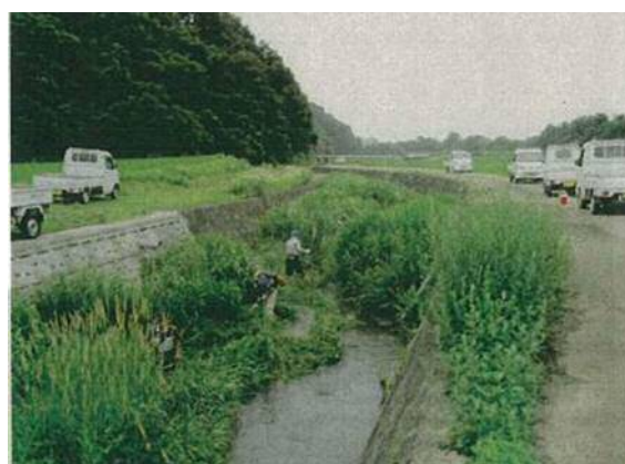
【水路・農道管理状況】