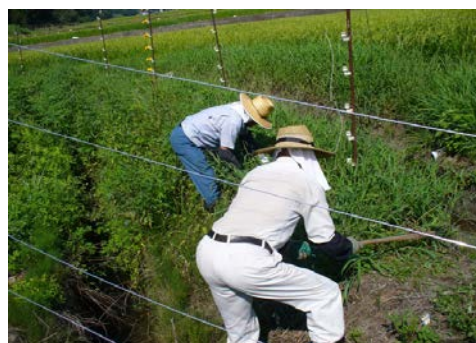
【電気柵の管理状況】