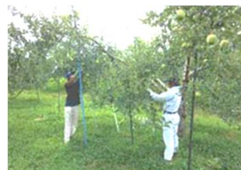
りんご園での作業

・株式会社ひだまり (就労継続支援A型事業所・B型事業所) から施設外就労として、また自社の就労継続支援B型事業所からも精神障害者、知的障害者及び身体障害者の計16名が農作業に従事。