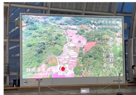
さいたま新都心駅大型映像装置による「つなぐ棚田遺産」のPR動画