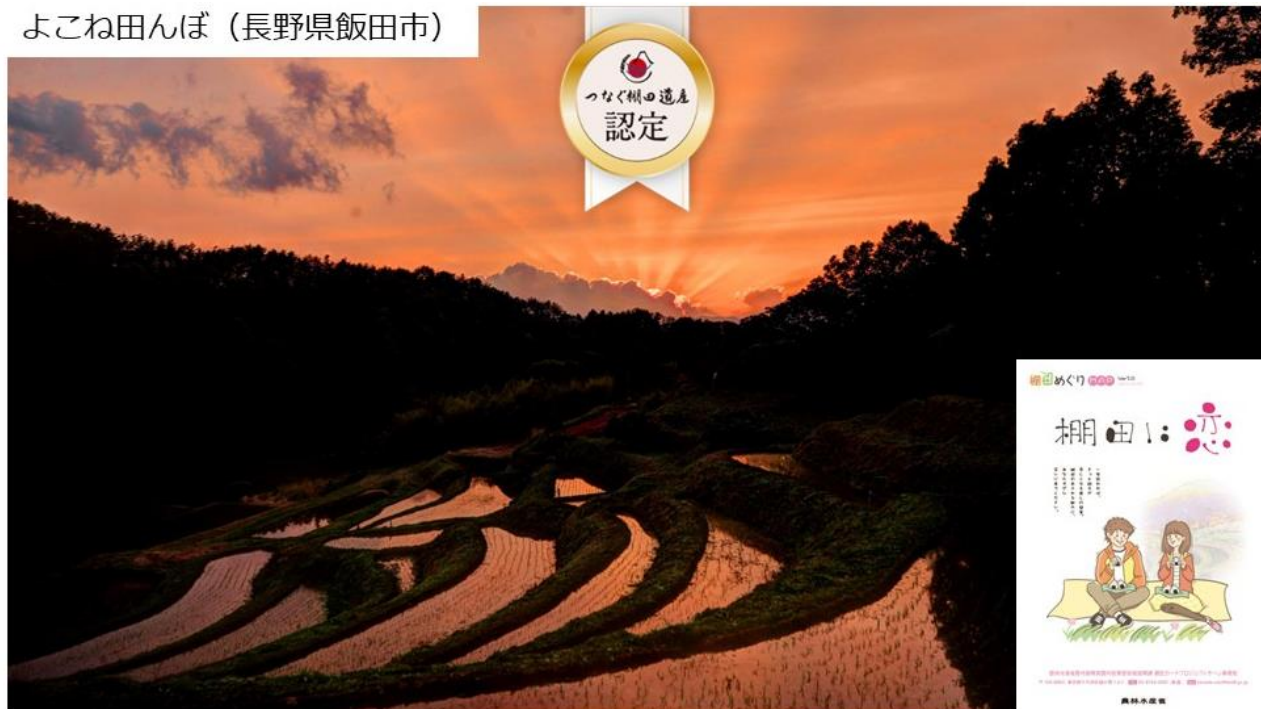
よこね田んぼ（長野県飯田市）

「棚田」とは、傾斜地に等高線に沿って作られた水田であり、田面が水平で棚状に見えるもの。農産物の供給、国土の保全、水源の涵養、生物の多様性の確保、良好な景観の形成、伝統文化の継承等の多面的機能を有しており、農業生産活動を主体としつつ、地域住民等の共同活動によって守られている国民共通の財産である。