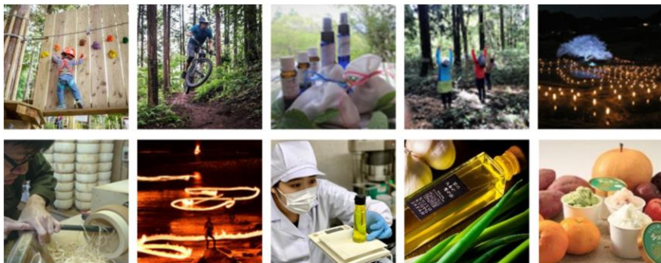
農山漁村発イノベーションの取組みのイメージ