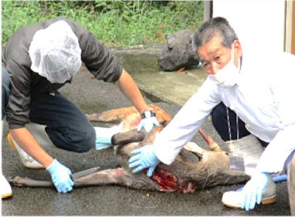
猟友会員への放血処理指導