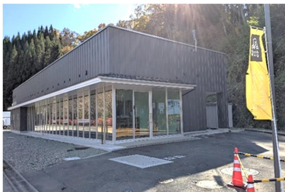
長野市ジビエ加工センター【モデル地区】

* 捕獲鳥獣のジビエ利用を巡る最近の状況の詳しい内容は、こちらをご覧ください。 https://www.maff.go.jp/j/nousin/gibier/suishin.html (農林水産省)