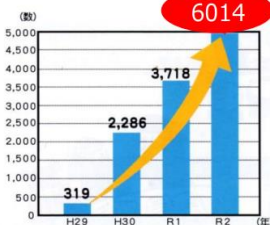
●埼玉県の子供の居場所