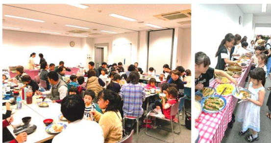
●全国の子ども食堂