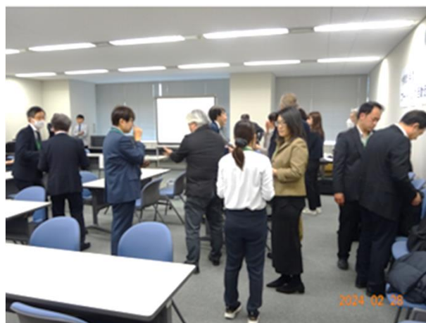
【対面参加者による交流会の様子】