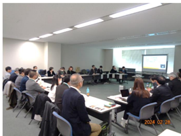
【取組事例発表時会場の様子】

続いて意見交換が行われ、食品関連事業者からは、「フードバンクとのマッチングで苦労した。」、フードバンク団体からは「保管場所等のインフラ整備が困難。」、「職員・ボランティアが足りない。」、「資金確保が難しい。」などの意見が出るなど活発な情報交換が行われた。その後、対面参加者による交流会が行われ、新たなつながりの場となった。