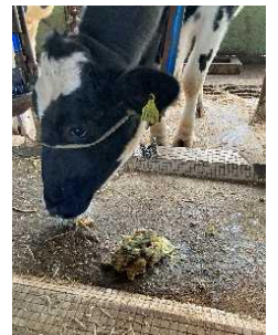
乳量・乳質への影響を調査