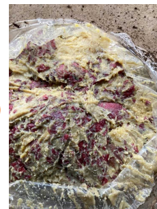
袋詰めした干し芋残渣を地中に貯蔵し、一定期間経過後開封