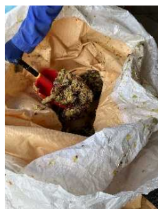
1回分を桶に移しスcoopで給与