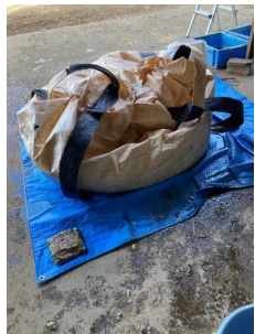
フレコンバックで引取り