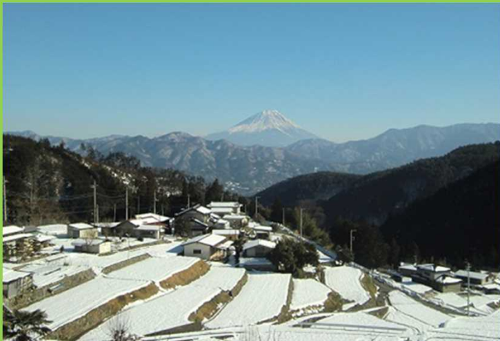
棚田から見える富士山（冬）