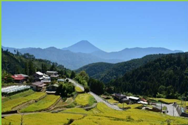
棚田から見える富士山（秋）