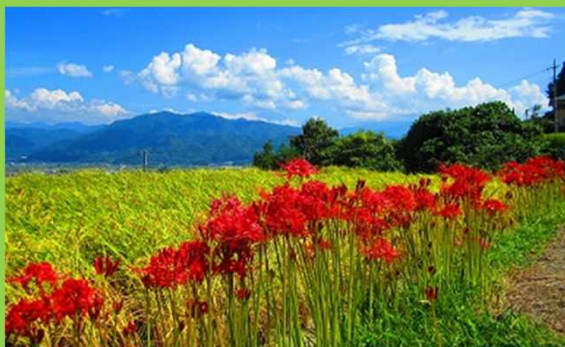
棚田に咲く彼岸花