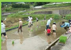
棚田オーナー制度の 田植え作業