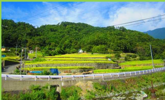
下から見上げた棚田