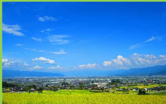
棚田から望む甲府盆地