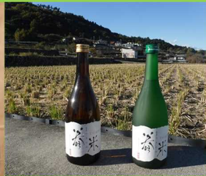
菴米の棚田米の袋・棚田米を原料とした清酒菴米