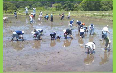
棚田オーナーによる 田植え体験会