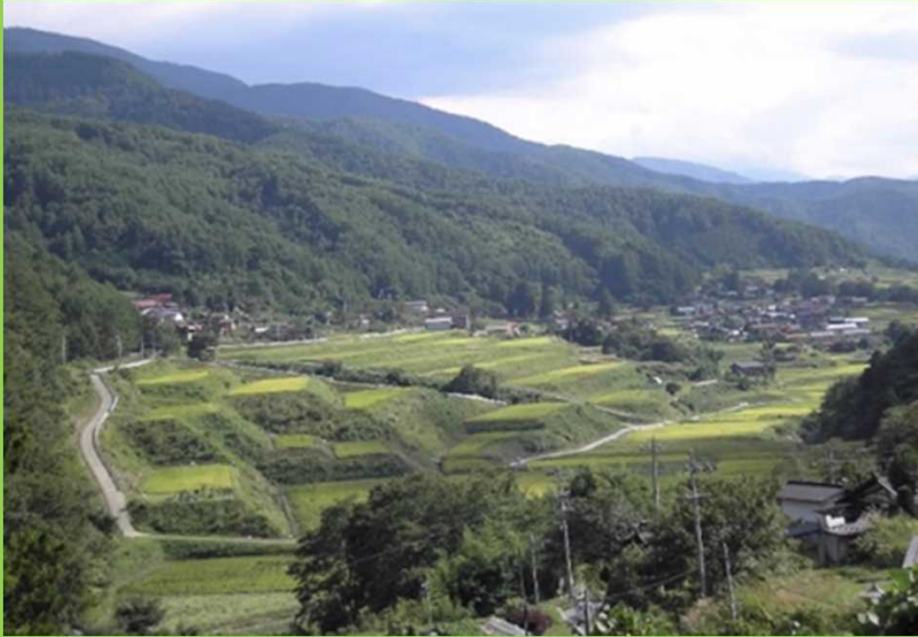
酒米を育む力強い棚田