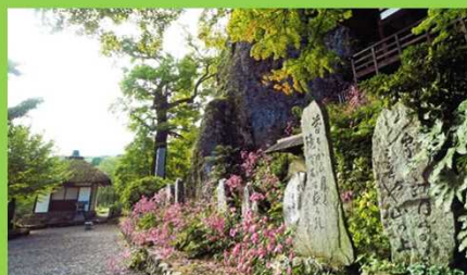
「長楽寺」古人の遊び心である文学碑が45基建てられている。