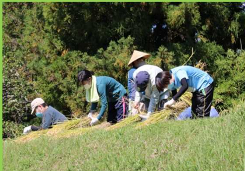
稲刈り体験イベントに参加したオーナーの皆さん