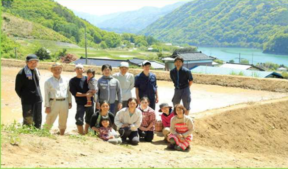
地域住民と密な関係を構築しながら営農を行っている。