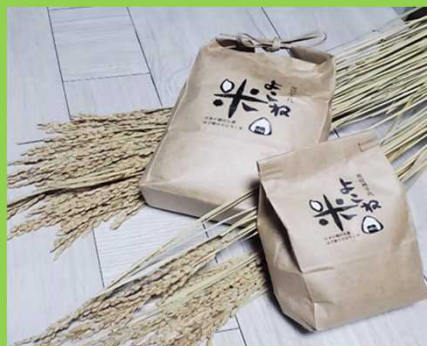
棚田で収穫したコシヒカリ