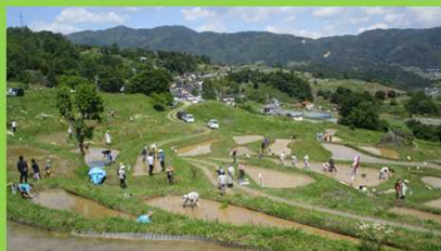
棚田貸します制度「田植えイベント」の様子(例年5月下旬実施)