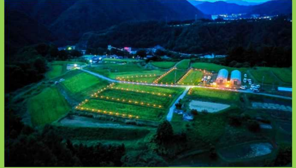
優れた景観の棚田を活かした「棚田祭」を運営企画した。