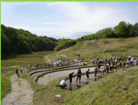
地元小中学生の田植え体験