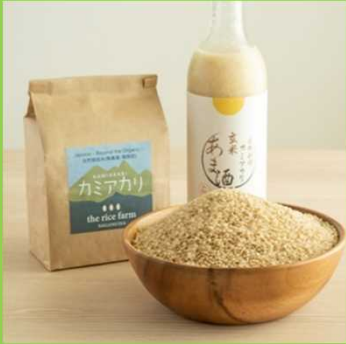
品種選定・栽培方法・加工品製造にこだわり高付加価値化を実現。