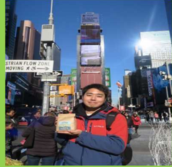
生産米の大部分をニューヨーク等の海外大都市圏に輸出している。