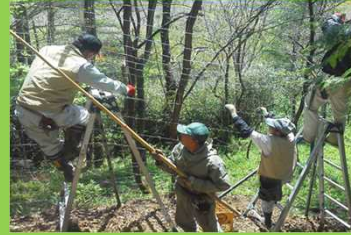
山室区集落単位での 猪鹿柵管理作業