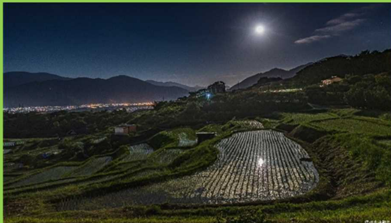
令和2年度に「月の都 千曲」で日本遺産に認定された。