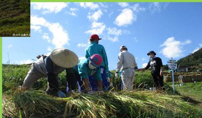
児童主体による棚田農作業体験の様子