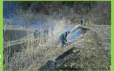
三義農業振興センターによる 棚田畦畔草焼き