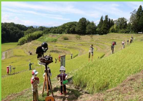
第22回よこね田んぼ案山子コンテスト