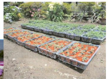
組織メンバーが作った苗