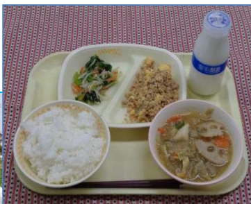
かき菜のおひたし（給食）