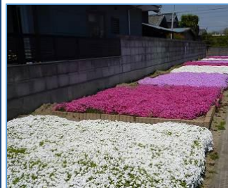
農道沿いに植栽した芝桜

● 農道脇などにコスモスやアジサイなど四季折々の花の植栽を実施。（苗作りも組織メンバーで実施。）