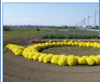
小菊で描かれた町章

● 休耕地にコスモスを植栽し、コスモスまつりを開催。地域の一大イベントとなっている。