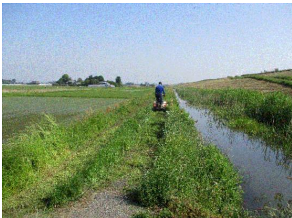
自走式草刈り機による草刈り