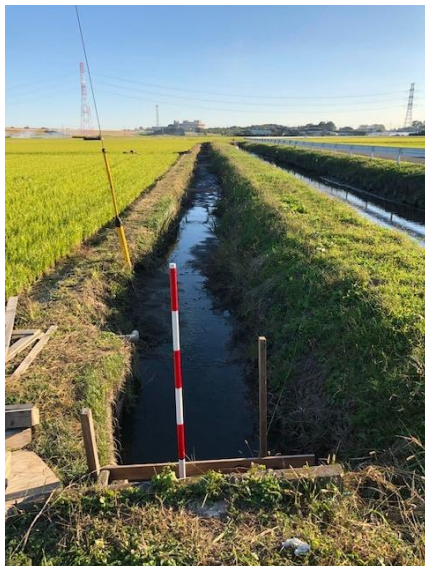
旧来から残る土水路

○泥上げなどの労力の軽減を図るため、計画的な土水路のコンクリート化について、直営施工により実施している。