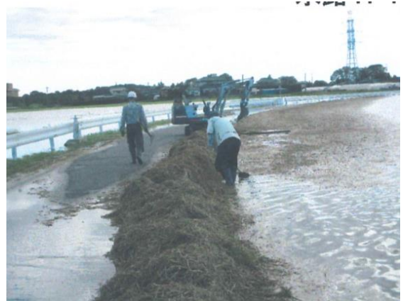
稲わら撤去の様子