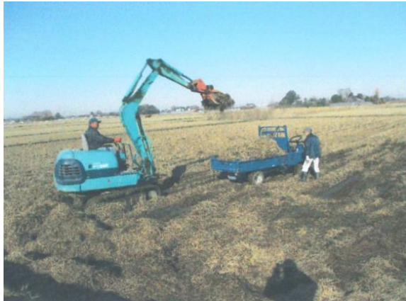
稲わら撤去の様子