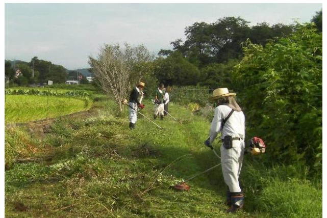
遊休地の草刈り作業