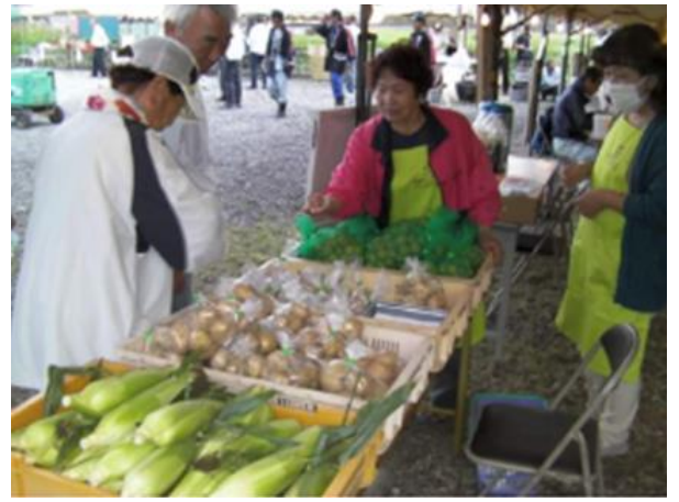
ホタルまつりでの直売風景