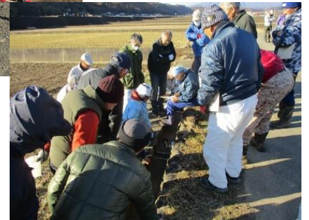
水路補修の実技研修