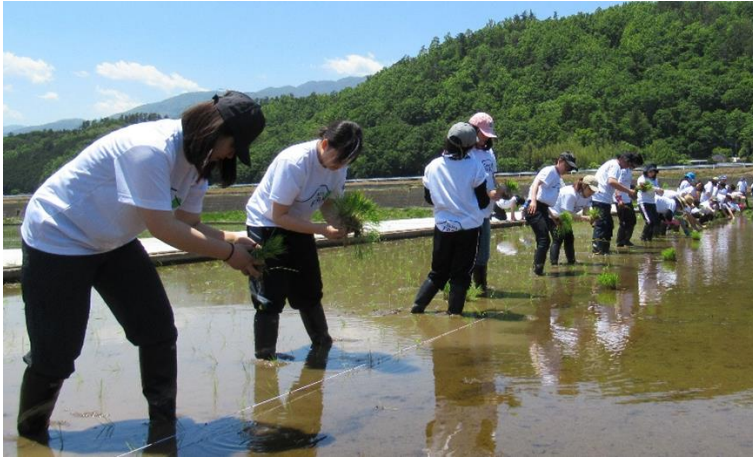
企業研修（農業体験）

○都内企業の研修（農業体験）の誘致、「小田川ホタルまつり」を開催し、都市農村交流を図っている。