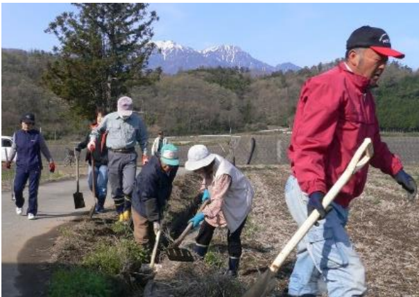
水路の泥上げ作業