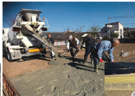
直営による農道舗装