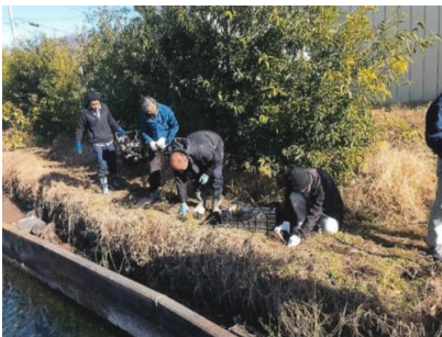
江戸彼岸桜 の植栽

○水路の更新や農道の舗装など全て直営施工で実施している。また、水路の補修の実技研修を実施し、技術の伝承を図っている。