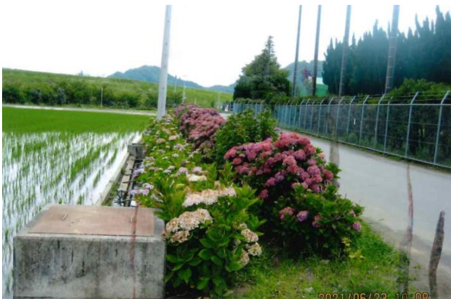
農道沿いに植栽したアジサイ