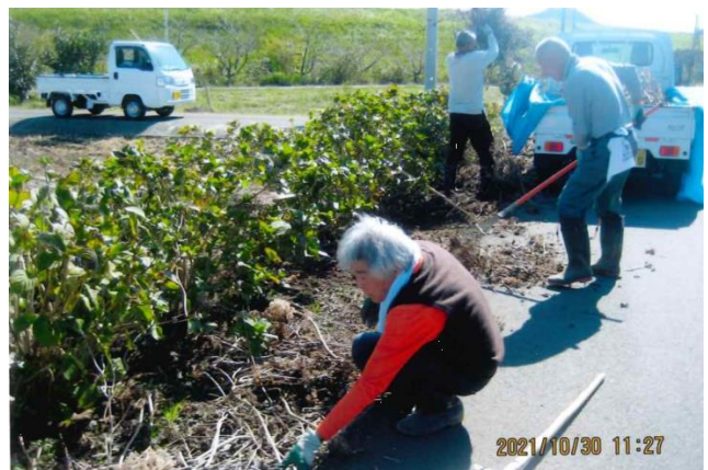
アジサイの剪定の様子