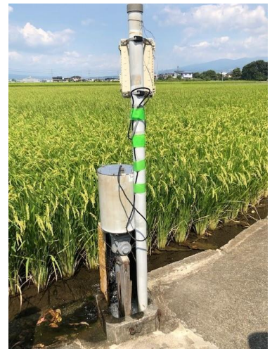
自動給排水バルブ