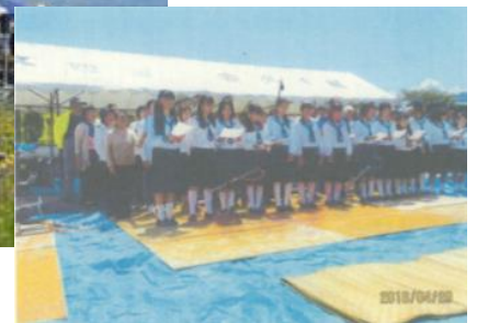
お花畑コンサート