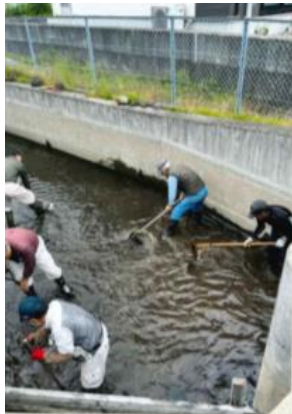
水路の泥上げ作業