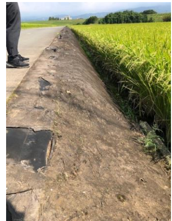
防草シートの設置