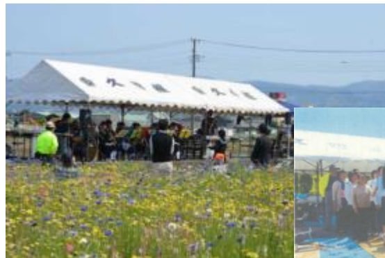
お花畑コンサート