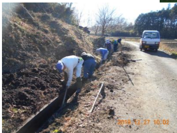
水路の泥上げ状況