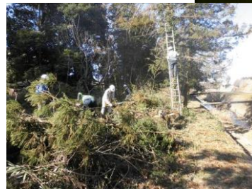
農道脇の雑木の伐採