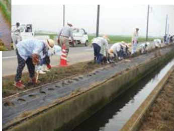
ヒガンバナの植栽