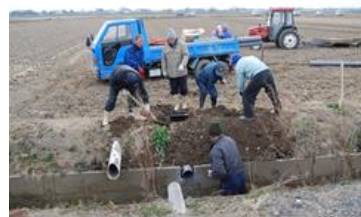
落水柵の設置風景