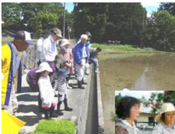
オーナーによる 田植風景