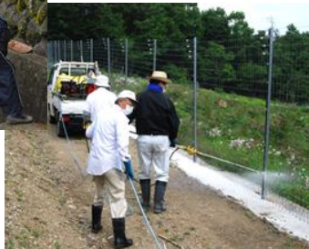
獣害防止柵周辺の除草