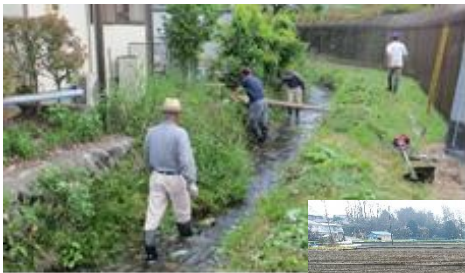
水路の草刈り作業