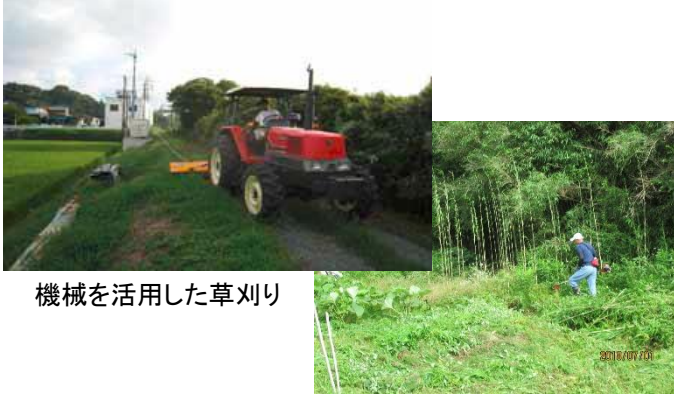
機械を活用した草刈り