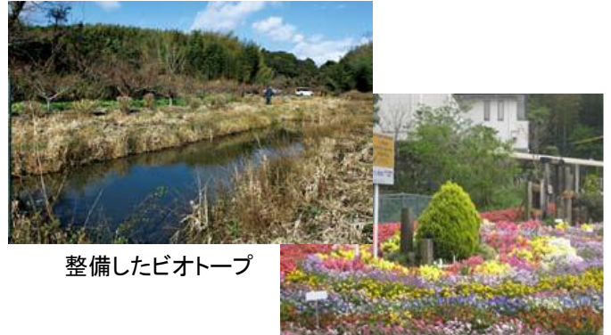
整備したビオトープ