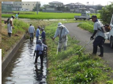
水路の草刈り作業