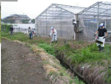
水路の泥上げ作業