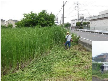
遊休農地の草刈り