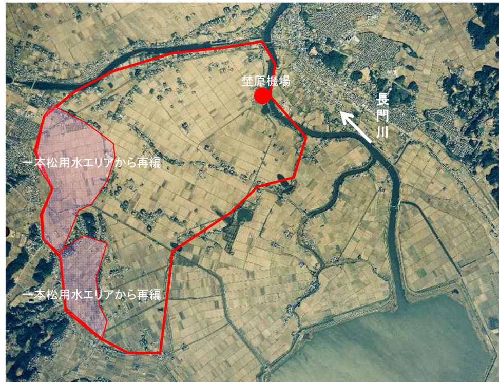
埜原機場受益地の航空写真