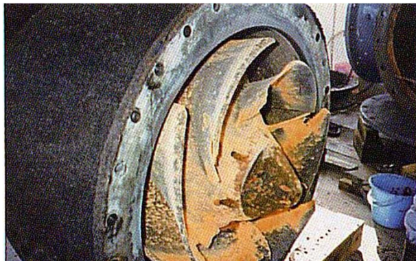
破損した羽根車の状況