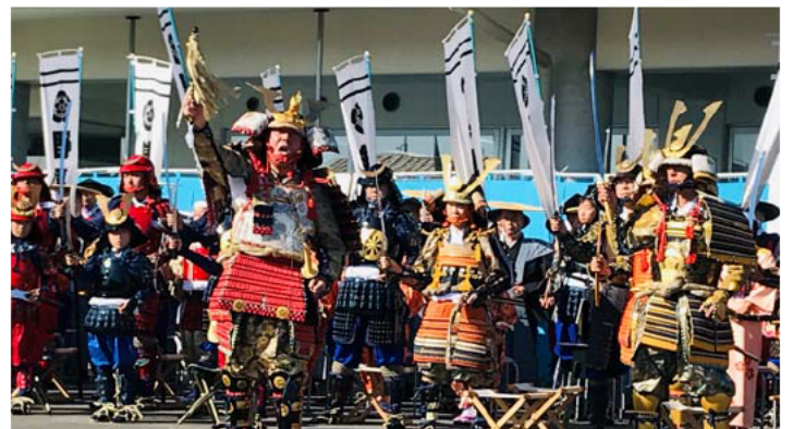
前橋総社秋元公歴史祭り