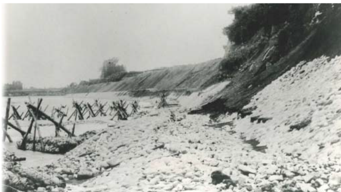
古くから天狗岩取水口付近で使われていた水制工法「越中枠」