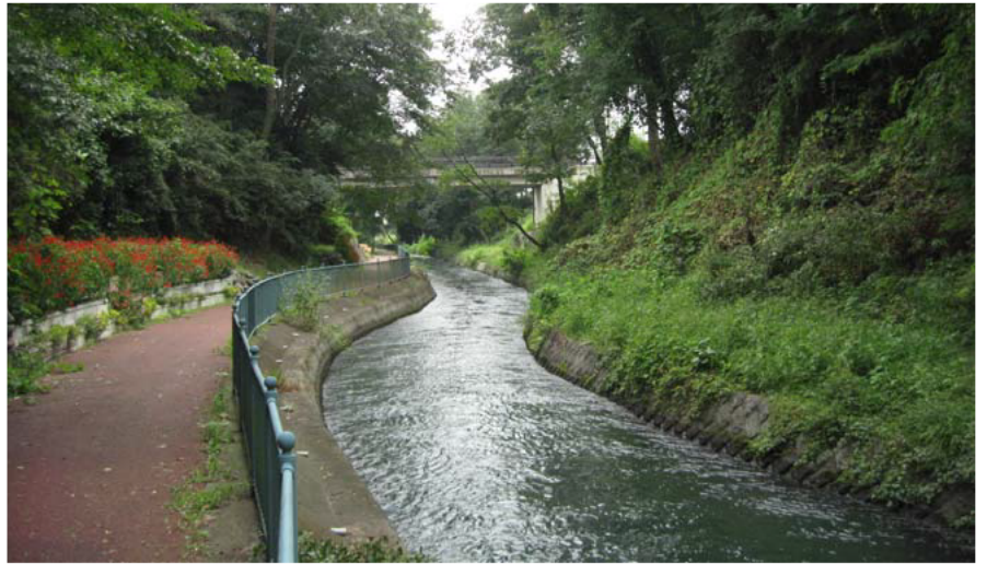
秋元長朝により開削された「天狗岩用水」

■400年を経た現在も、秋元公を讃えた祭りが盛大に開催され、人々が感謝を捧げている。