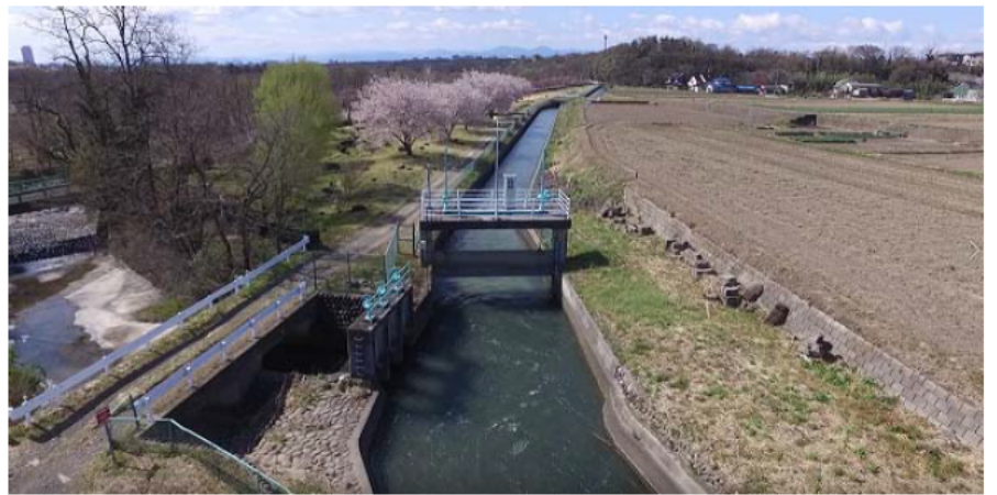
1998年のかんがい排水事業により改修された「制水門」と「余水吐門」