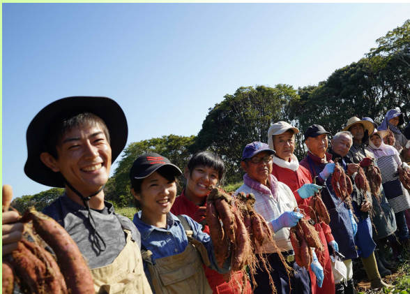
『日本の農業をステキにしよう』で集まったメンバー