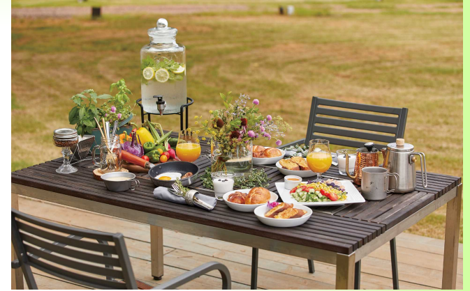
グランピング施設の食事