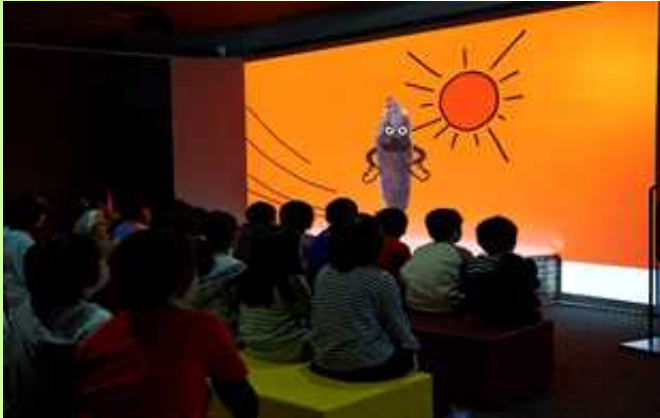
楽しく美味しく学ぶことが出来るミュージアム