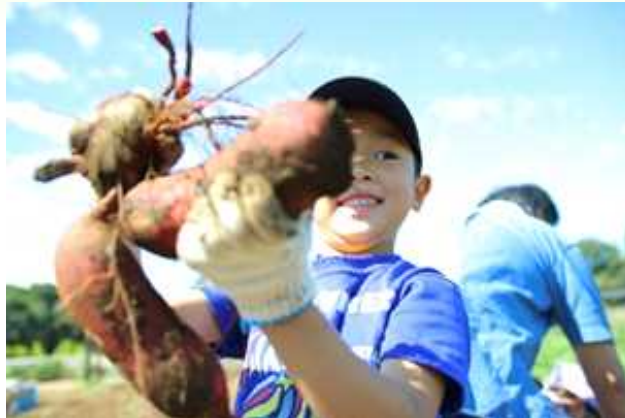
野菜や果物を収穫し、その場で加工