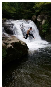
チャレンジ 森と源流の郷原体験