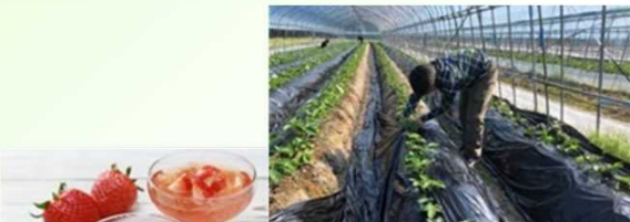
農福連携で働く従業員と「王さまいちごゼリー」