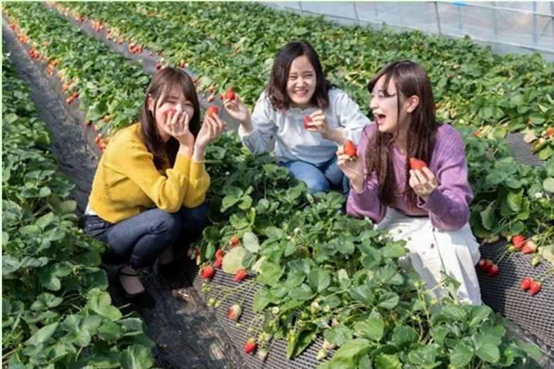
いちご狩りの様子