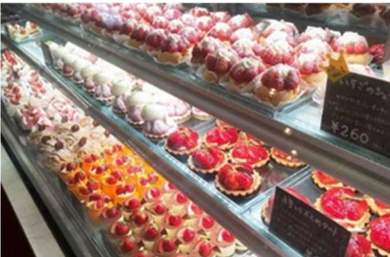
自社製いちごを使用した6次化商品