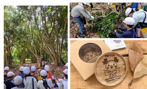
マテバシイ間伐見学と葉落とし体験、 間伐材コースター