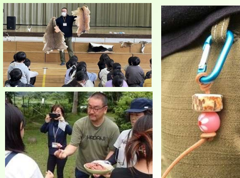
猟師工房「命の授業」の様子と 鹿角キーホルダー