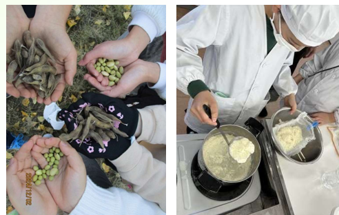
育てた小糸在来®大豆で豆腐作りをする児童